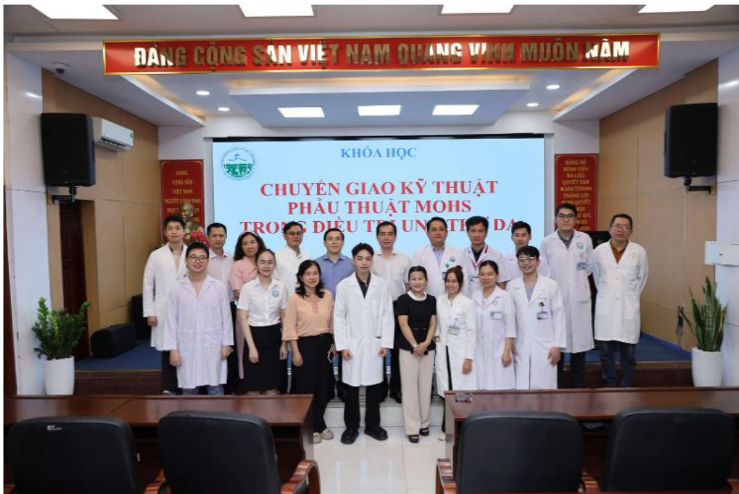
Bệnh viện Da Liễu TP.HCM chuyển giao kỹ thuật phẫu thuật Mohs trong điều trị Ung thư da cho các đơn vị trong mạng lưới Da Liễu khu vực phía Nam