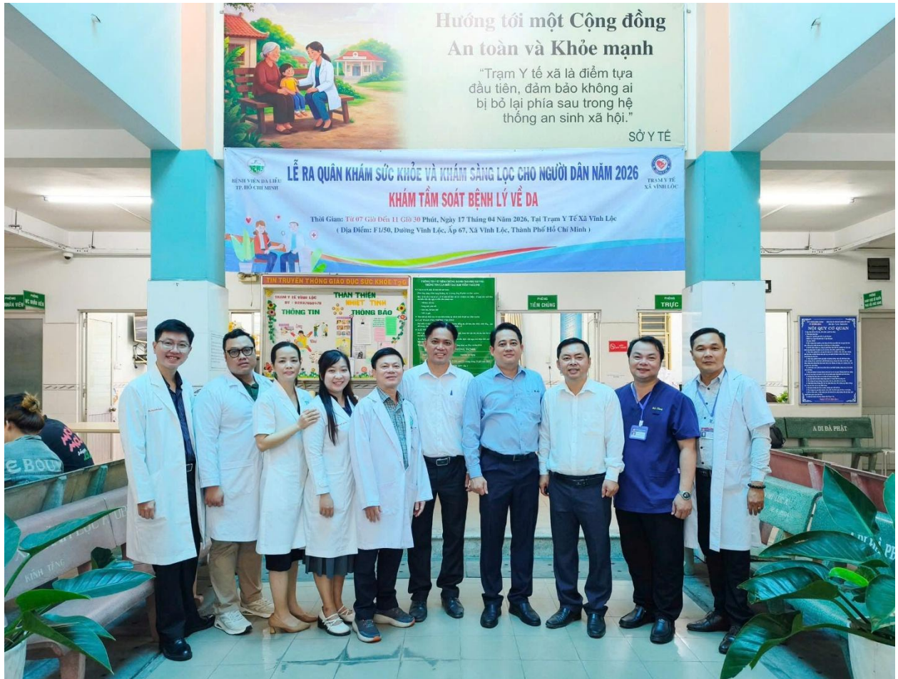
Đoàn Bệnh viện Da Liễu TP.HCM khám tâm soát bệnh da trong dịp Lễ ra quân khám sức khỏe và khám sàng lọc cho người dân năm 2026

Những chuyến đi ấy khiến người thầy thuốc hiểu rằng y đức không chỉ nằm trong bệnh viện. Y đức còn là khi mình chủ động bước đến gần cộng đồng hơn, lắng nghe nhiều hơn và quan tâm nhiều hơn đến những người còn khó khăn trong tiếp cận dịch vụ y tế. Với nhiều bác sĩ trẻ, đó cũng là những bài học đẹp về trách nhiệm xã hội của nghề y - nơi chuyên môn phải đi cùng lòng nhân ái.