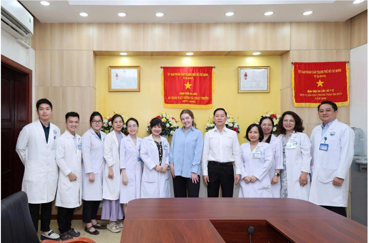
Học viên Bác sĩ nội trú năm cuối từ Mayo Clinic đến thực tập tại Bệnh viện Da Liễu

Đó là khi những học viên và bác sĩ quốc tế đến thực tập, làm việc tại bệnh viện cảm nhận rõ sự tận tâm của người thầy thuốc Việt Nam - từ sự kiên nhẫn giải thích bệnh cho những bệnh nhân lớn tuổi đến cách xử trí linh hoạt các ca bệnh khó, đặc thù của khu vực nhiệt đới. Có những buổi thảo luận ca bệnh kéo dài sau giờ làm, những cuộc trao đổi chuyên môn vượt qua khác biệt về ngôn ngữ và văn hóa, nhưng tất cả đều gặp nhau ở một điểm chung: tinh thần tận tụy với nghề và sự trân trọng dành cho người bệnh.