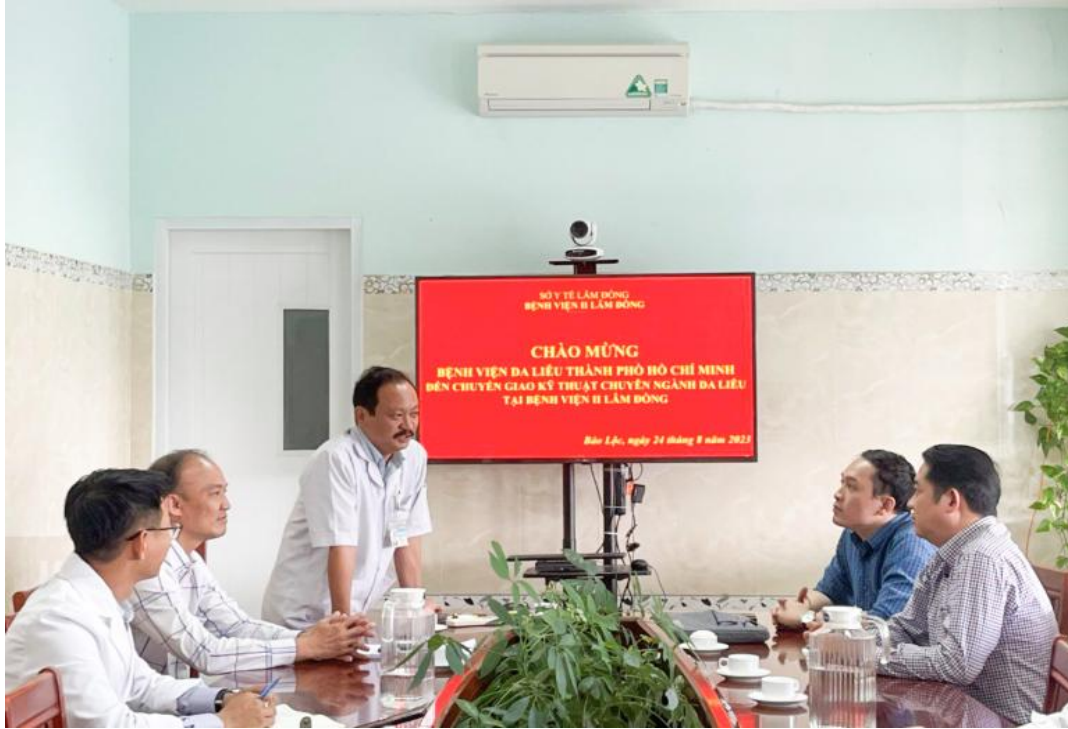
Đoàn Bệnh viện Da Liễu TP.HCM chuyển giao kỹ thuật chuyên ngành Da Liễu cho Bệnh viện Lâm Đồng