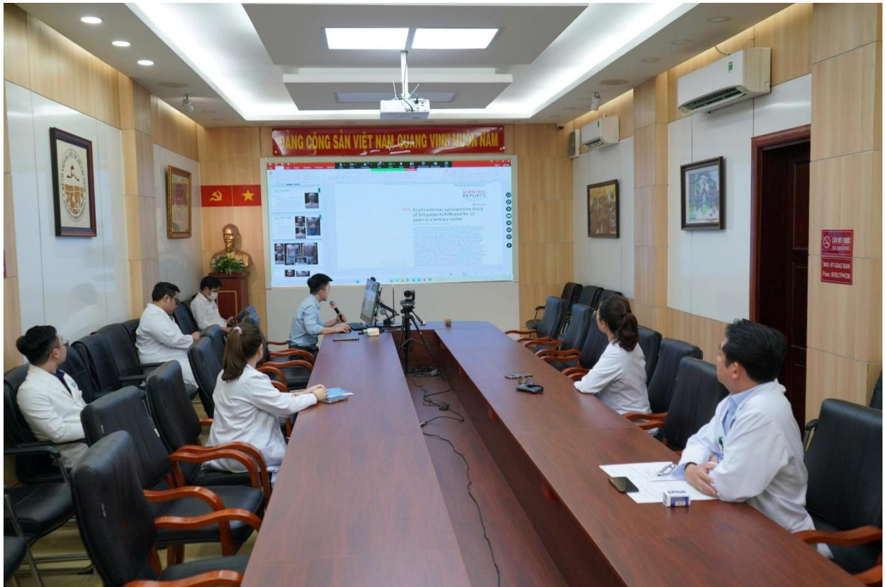
Hội chẩn trực tuyến theo mô hình ECHO cùng các đơn vị có chuyên khoa Da Liễu

Những chương trình về bệnh Phong và các nhiễm khuẩn lây truyền qua đường tình dục cũng mang một ý nghĩa rất đặc biệt. Bởi phía sau bệnh tật đôi khi không chỉ là đau đớn thể chất, mà còn là mặc cảm và sự kỳ thị. Việc đào tạo, hỗ trợ chuyên môn cho tuyến dưới không chỉ giúp phát hiện sớm và điều trị hiệu quả hơn, mà còn góp phần giúp người bệnh được chăm sóc bằng sự cảm thông, tôn trọng và sẻ chia.