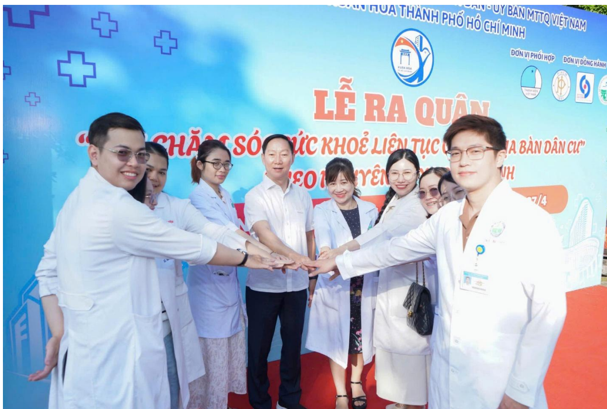
Đoàn Bệnh viện Da Liễu TP.HCM trong dịp khám sức khỏe hưởng ứng ngày Sức khỏe toàn dân 7/4

Trong hành trình ấy, hợp tác quốc tế trở thành một nhịp cầu đặc biệt để kết nối tri thức và lan tỏa những giá trị tốt đẹp của ngành y.