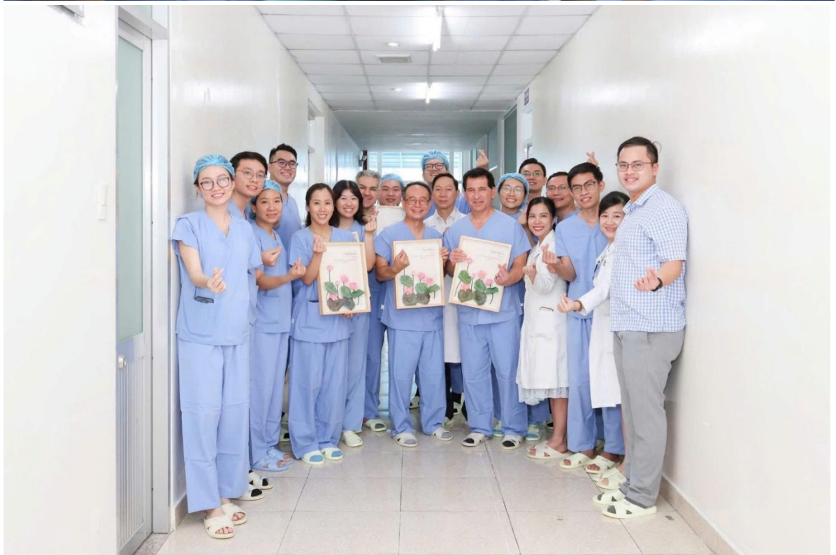
Đoàn Phẫu thuật Mohs Blade and Light đến trao đổi chuyên môn cùng các Bác sĩ Bệnh viện Da Liễu