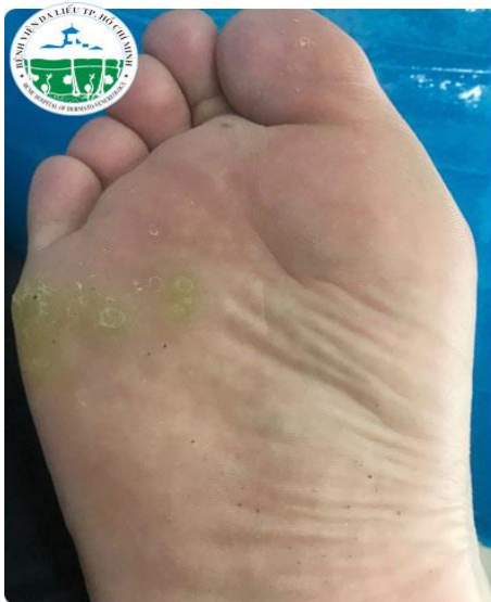
BƯỚC 1: Thương tổn được làm sạch với dung dịch sát trùng

Mục tiêu điều trị mụn cóc là tiêu diệt virus và loại bỏ các tổn thương, nốt mụn mà không để lại sẹo. Xít nitơ lỏng thường được sử dụng để điều trị mụn cóc, nhất là cho những trường hợp khó trị như thương tổn không lõ, ở lòng bàn tay, lòng bàn chân. Nitơ lỏng với độ lạnh -1960C sẽ làm tổn thương mô, ứ đọng mạch máu, tắc mạch, viêm, đóng băng các khoang ngoại bào...gây phá hủy mụn cóc.