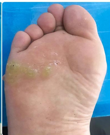
BƯỚC 2: Thoa gel siêu âm lên bề mặt thương tổn