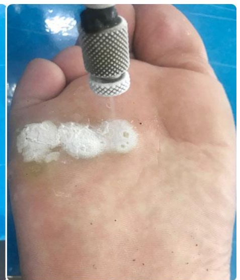
BƯỚC 3: Xít ni tơ lỏng lên thương tổn đã có gel siêu âm

Bệnh viện Da Liễu TP.HCM khuyên nên thoa gel siêu âm lên mụn cóc trước khi tiến hành kỹ thuật xít nhằm duy trì độ lạnh của nitơ lỏng lâu hơn trên thương tổn, từ đó giúp tăng hiệu quả điều trị. Ngoài ra, bệnh viện còn sử dụng ly giấy, cắt lỗ đáy ly tương ứng kích thước sang thương để tăng hiệu quả điều trị.